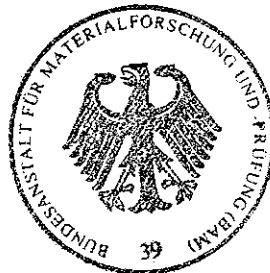
Dipl. - Ing. (FH) A. Nieruch

(Dieser Zulassungsschein besteht aus 4 Seiten.) (This approval covers 4 pages.)